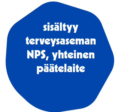
Suun terveydenhuollon yksikkö