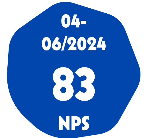
Suun terveyden huollon yksikkö